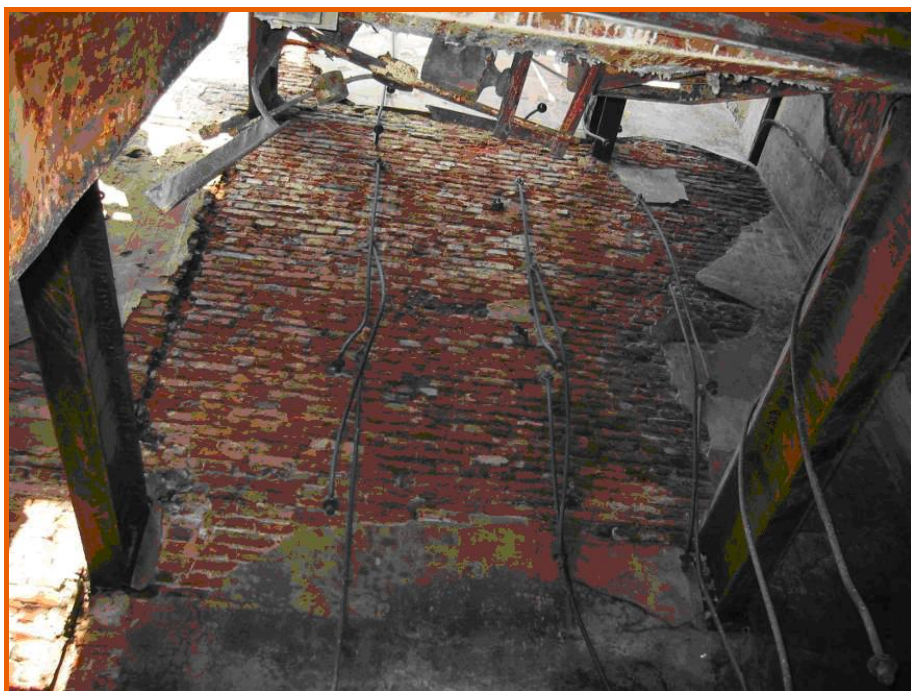
Silos-fariniera in legno all'interno del mulino

A un certo punto, durante l'operazione di ripompaggio, è avvenuta l'esplosione della miscela aria-farina nel silos-fariniera che ha causato il crollo e l'incendio del corpo centrale dell'edificio.