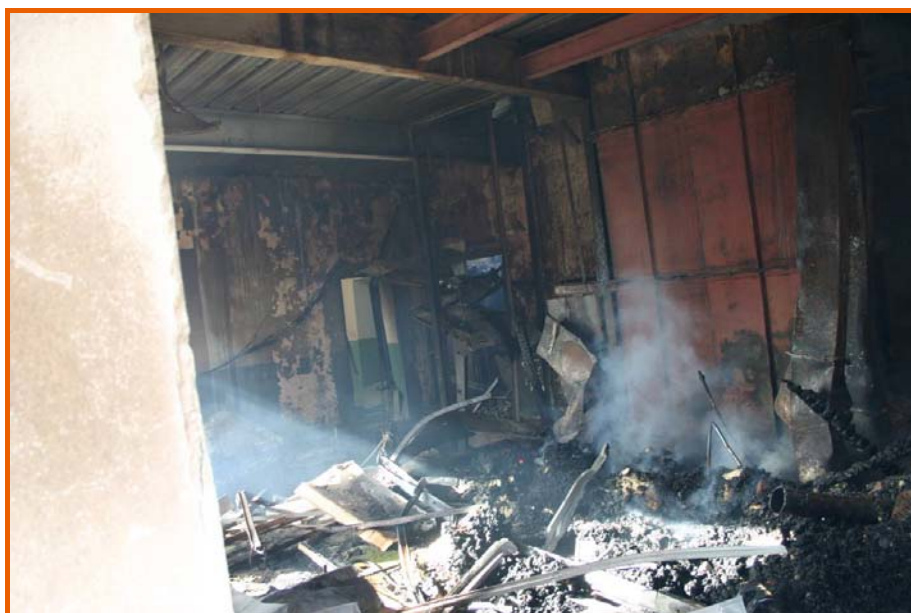
Area del silos-fariniera, del montacarichi e dell'ufficio con la bilancia al piano terra del corpo centrale del mulino

Dopo circa una decina di minuti, è avvenuta l'esplosione dell'autocisterna che si era incendiata in seguito alla prima esplosione.