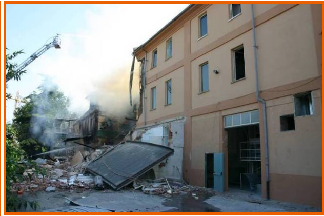
Corpo centrale dell'edificio in via Torino