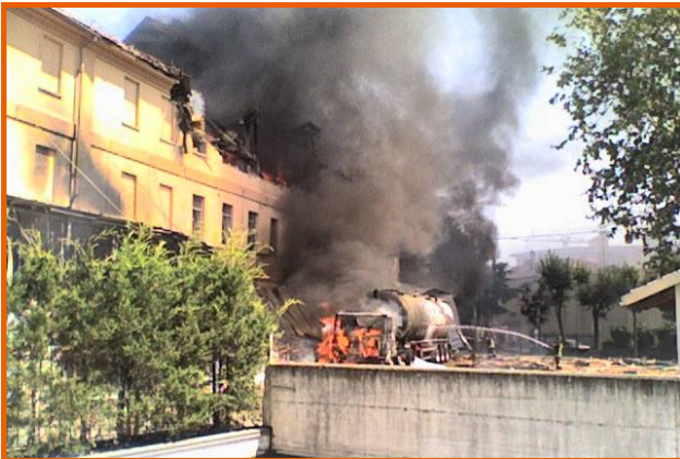
Corpo centrale dell'edificio, autocisterna in fiamme e cortile interno del molino, visti dal condominio di fronte, in via Paglieri

Verso le 14 e 30 del 16 luglio 2007, è esploso uno dei silos che conteneva farina al Molino Cordero di Fossano (Cuneo). Un quarto d'ora più tardi, quando i primi volontari del Comando dei Vigili del Fuoco erano già sul posto, è scoppiata un'autocisterna ferma sul piazzale, che si era incendiata in seguito alla prima esplosione.